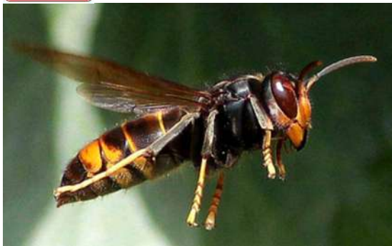
Le frelon asiatique, l'ennemi de l'abeille.

Il se place à l'entrée des ruches, en vol stationnaire et se rue sur l'abeille qu'il capture avec ses longues pattes pour l'emmener à manger aux larves de son nid .