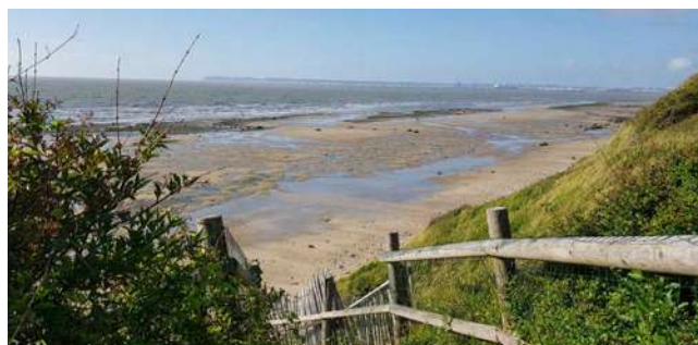
La plage du Grand Bec et du Doigt Pisseux

Nous vous incitons également à ne rien laisser derrière vous et à apporter vos déchets jusqu'aux poubelles mises à votre disposition aux abords des plages.