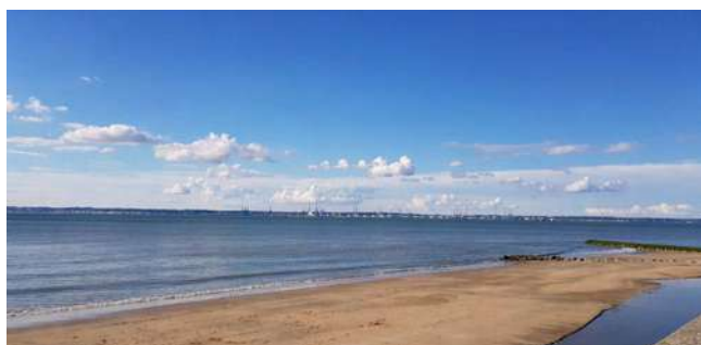
La plage des Bains

Quel bonheur de les avoir retrouvées, après plus de 2 mois de confinement ! A nouveau, elles apportent à tous de bons moments de plaisir et de convivialité. La forte présence de visiteurs, touristes et locaux le WE du 14 Juillet a montré combien nos si belles plages demeuraient attractives.