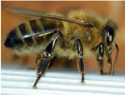
Apis Mellifera Mellifera

Patrimoine irremplaçable , notre abeille noire européenne, Apis Mellifera Mellifera (« abeille porteuse de miel ») est une perle de plus en plus rare qu'il faut protéger d'urgence !