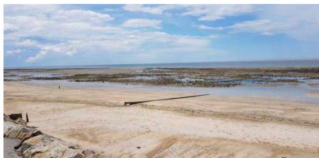
La plage des Graves

Nous vous incitons également à ne rien laisser derrière vous et à apporter vos déchets jusqu'aux poubelles mises à votre disposition aux abords des plages.