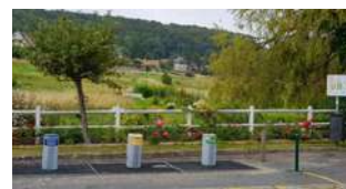
Face à la Mairie

Il y a une déchetterie à quelques kilomètres du centre bourg (Croix Sonnet). Pour y accéder, il vous suffit de demander une carte aux services de la 4CF.